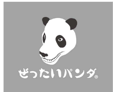
図①株式会社ぜったいパンダロゴ