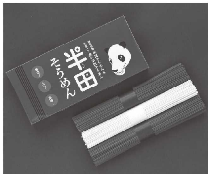
写真①パンダそうめん